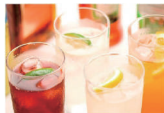
デルソーレオリジナルアペリティーヴォ

アペリティーヴォとはイタリア語で食前酒。食前には、スプマンテ(スパークリングワイン)や軽めのカクテルを飲むようです。